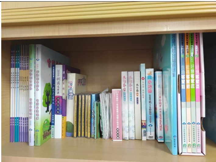
客語教學圖書資源學習專櫃