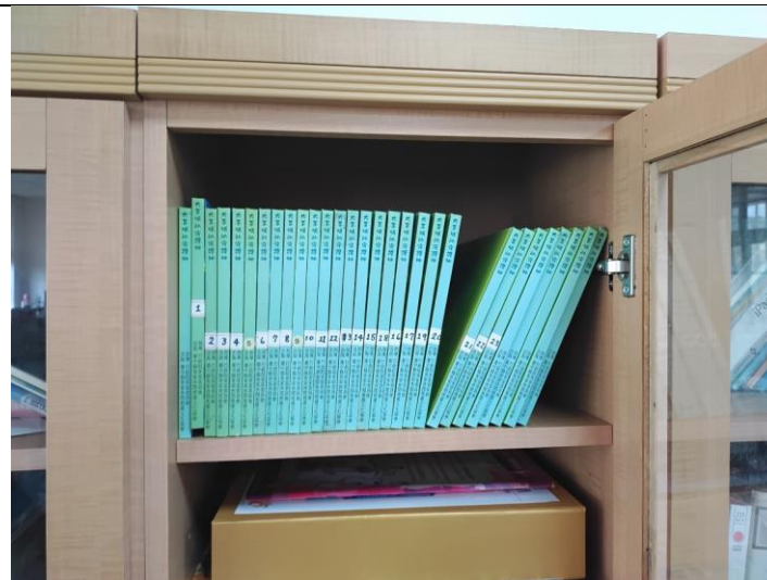
客語學習圖書資源學習專櫃